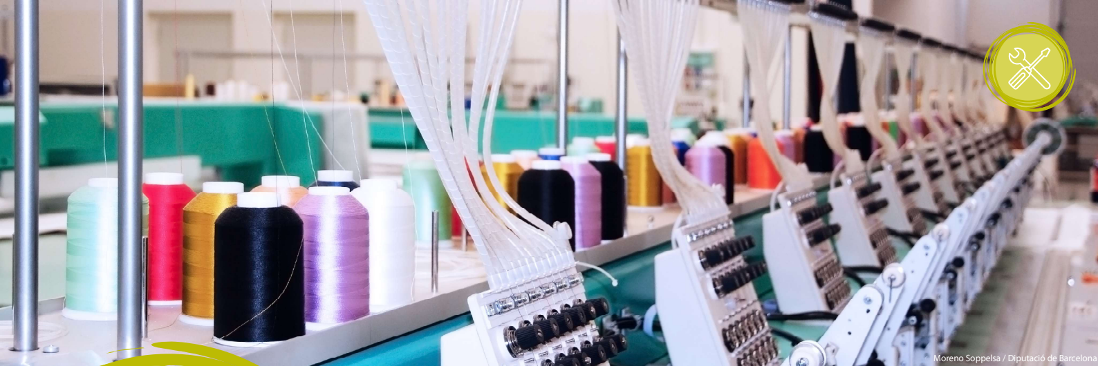
Moreno Soppelsa / Diputació de Barcelona